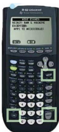
TI 82 Advanced