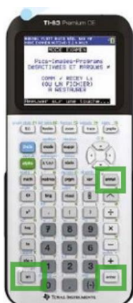
TI 83 CE