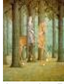
René Magritte – Le Blanc Seing

René Magritte, peintre, graveur, publiciste et photographe devient le chef de file de la peinture surréaliste à partir des années 1930.