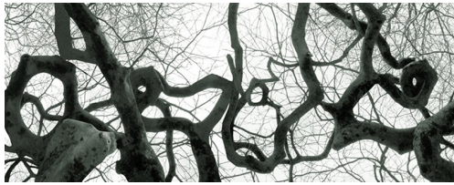
Marie Jésus Diaz - Hivert

Découper les images en bandes et recomposer une production par collage en alternance.